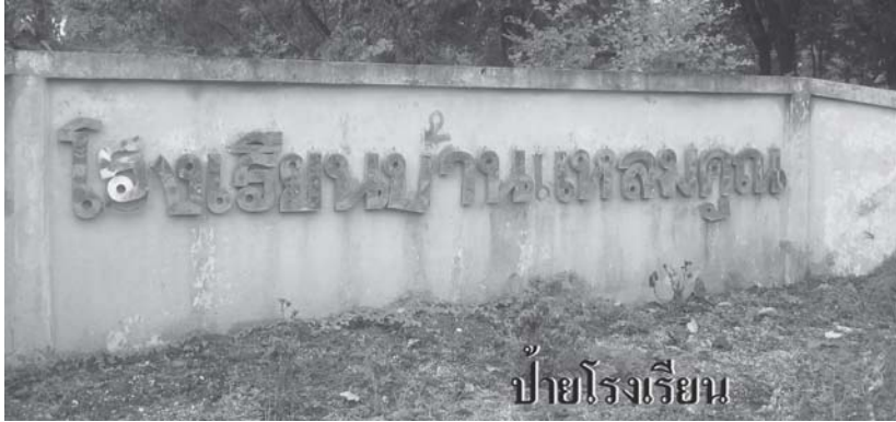
ป้ายโรงเรียน