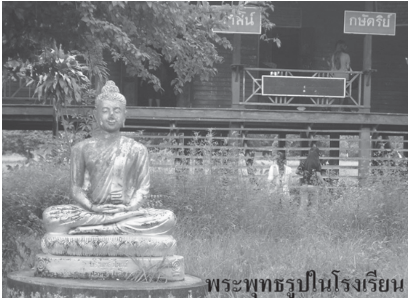
พระพุทธรูปในโรงเรียน